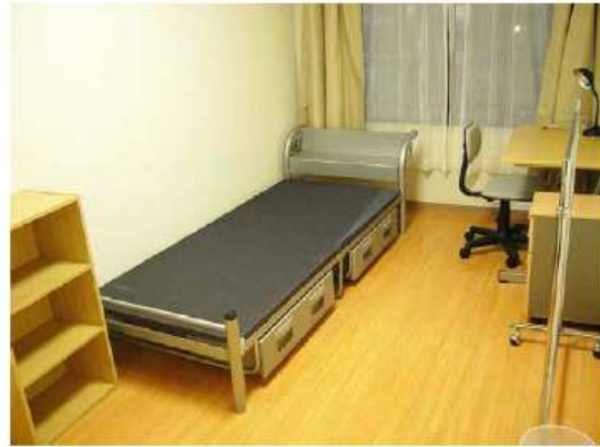
單人房 (9 m 2 )