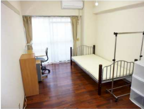
單人房 (9 m 2 )