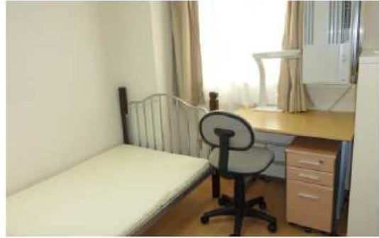
單人房 (6.8 m 2 )